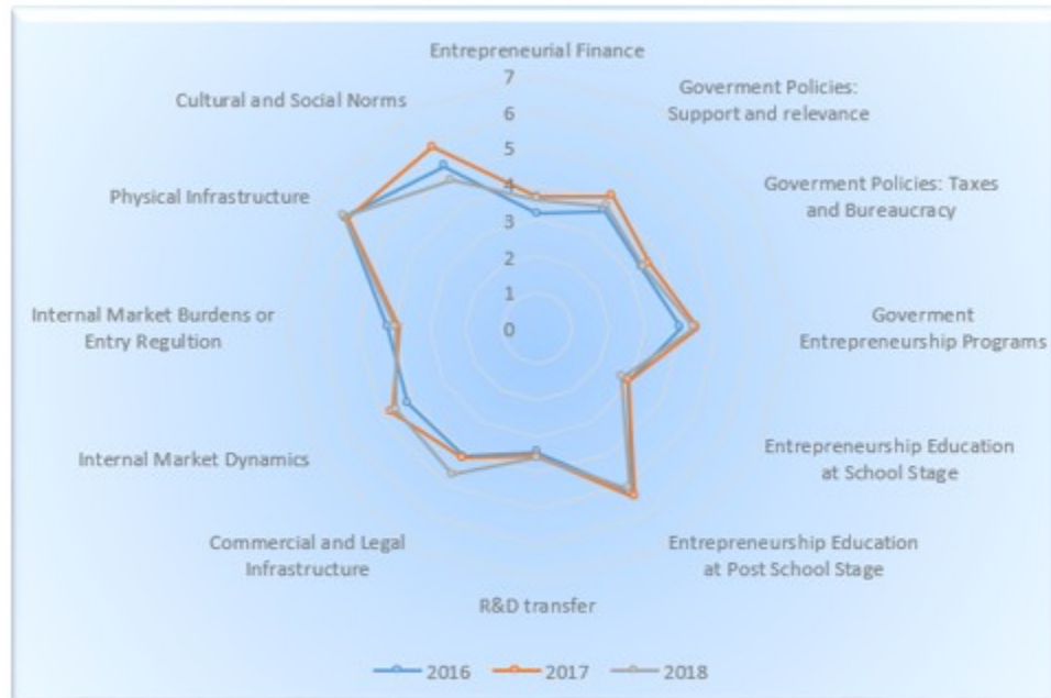
Figura 2. COMPARATIVO DEL ECOSISTEMA EMPRENDEDOR DE COLOMBIA

constante no solo a lo largo de los tres años si no en los diferentes rangos analizados.