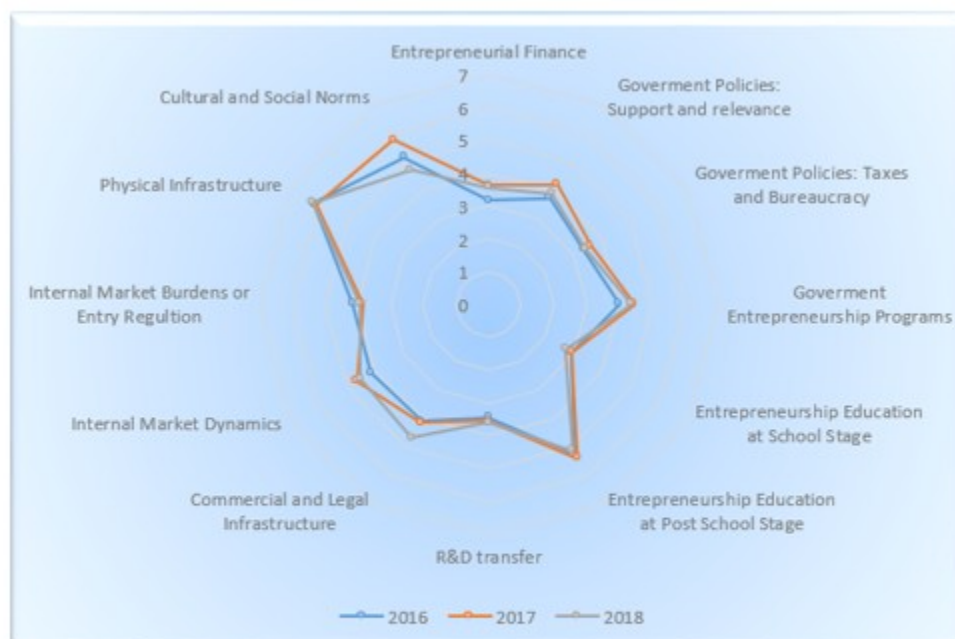
Figura 2. COMPARATIVO DEL ECOSISTEMA EMPRENDEDOR DE COLOMBIA

constante no solo a lo largo de los tres años si no en los diferentes rangos analizados.